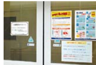
喫煙所には、喫煙マナーに関する注意書き、啓発のチラシで、路上喫煙の防止や非喫煙者への心配りを訴える