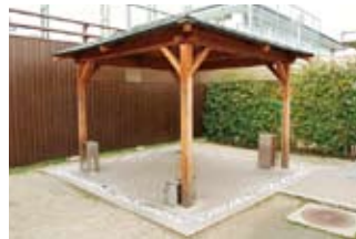
東屋風の屋外喫煙所。平成20年度に設置場所を検討したうえで予算化し、全面禁煙に合わせ完成させた。敷地内にはこの喫煙所を含め、屋外喫煙所が数カ所設置されている

ここでは全面禁煙へ移行した事業場の例をご紹介します。敷地内に事務棟や工場が点在するこの事業場では、平成21年10月1日付で建物の各フロアに設置されていた喫煙スペースを廃止、喫煙は屋外と建物屋上の喫煙所に限定する、全面禁煙に踏み切りました。それに先立ち、平成19年度以降、社用車の禁煙化、たばこ自販機の撤去などハード面の対策と並行して、禁煙教室の定期的な実施、産業医による禁煙相談、ニコチンパッチの無料配布など禁煙支援活動も積極的に展開、その結果平成19年度には26.8%だった喫煙率が、平成22年度には20.2%へと減少しました。喫煙者に対し受動/能動喫煙の害を周知し、意識改革・行動変容へと結び付けたことが、成功の秘訣といえそうです。