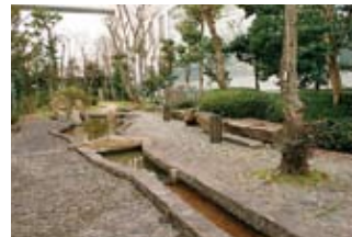
中庭に設けられた喫煙所。今後は非喫煙者の通行が多い喫煙所を廃止し、建物から離れた場所に集約することも検討中