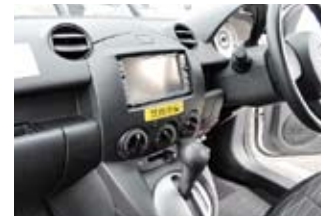
全面禁煙に先立ち禁煙化された社用車。「禁煙車」のステッカーが貼られる