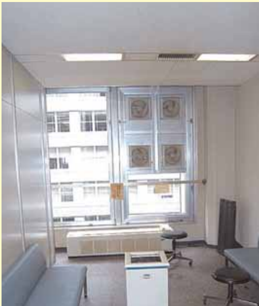
換気扇を4台設置して十分な排気量を確保した喫煙室

局所排気装置方式のフードを設置し、大型ファンで十分な排気量を確保した喫煙室。喫煙者が多く、短い休憩時間に多くの喫煙者が集中する場合に効果的である。