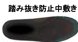
踏み抜き防止中敷き